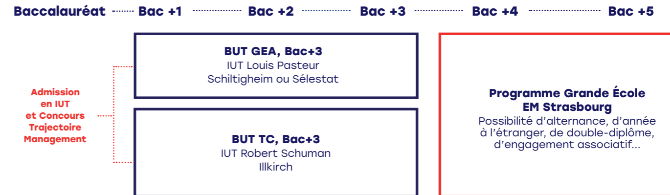
Schéma des études